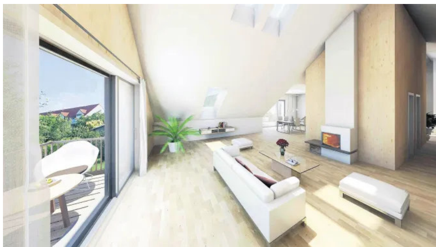
Wohnräume können wahr werden - im Dresdner Holzpalais.